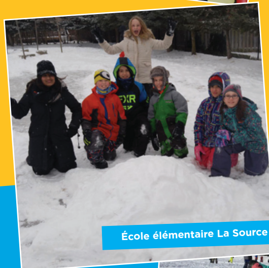
École élémentaire La Source

Les élèves sont en grande préparation avant de partir pour une ballade en ski de fond.