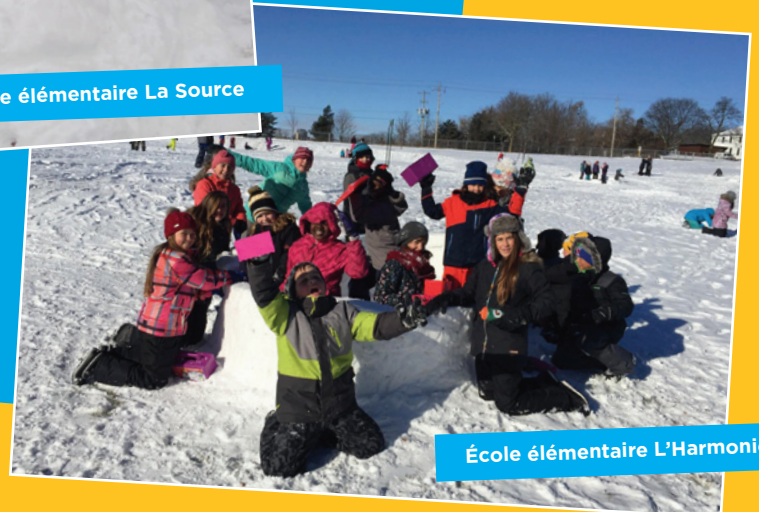
École élémentaire L'Harmonie