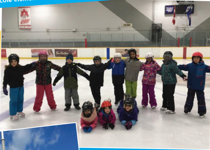
Du plaisir à l'état pur sur la glace, patins aux pieds!