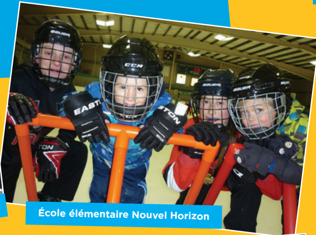
École élémentaire Nouvel Horizon