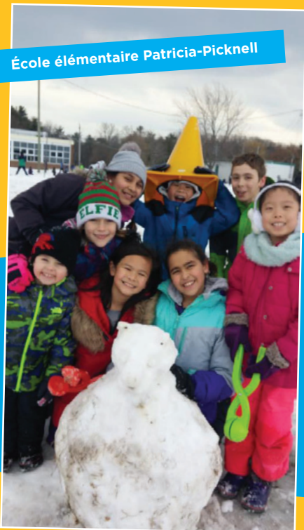
École élémentaire Patricia-Picknell

Quelles belles réalisations collectives de la part des élèves!