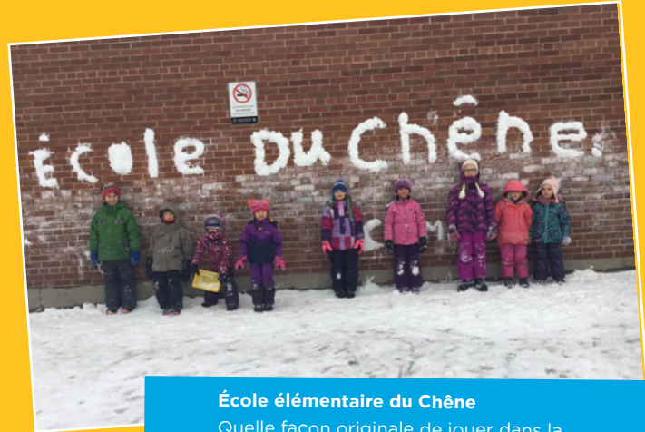
École élémentaire du Chêne

Quelle façon originale de jouer dans la neige! Félicitations pour votre créativité!