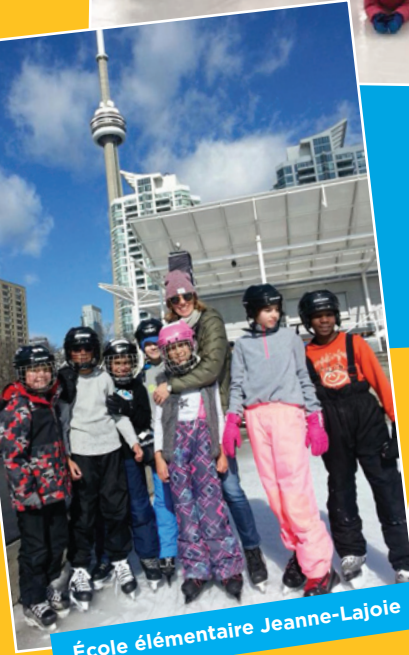
École élémentaire Jeanne-Lajoie

Quelle façon originale de jouer dans la neige! Félicitations pour votre créativité!