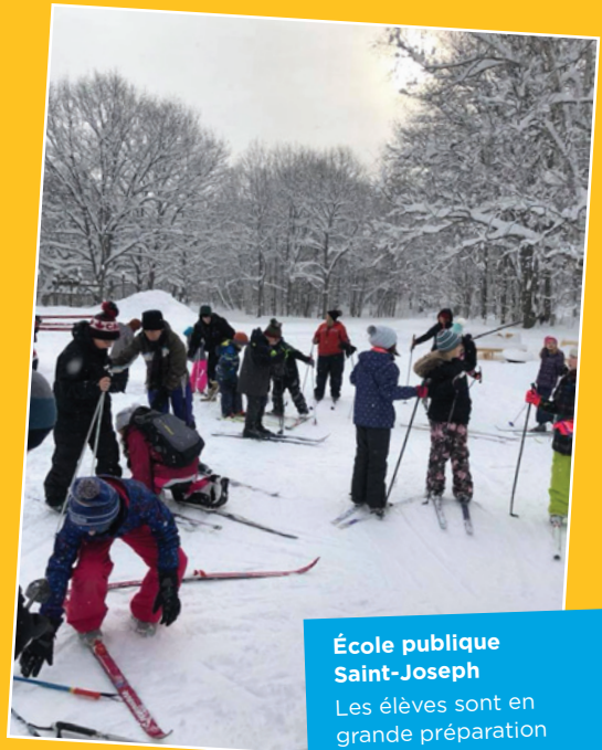
École publique Saint-Joseph

Les élèves sont en grande préparation avant de partir pour une ballade en ski de fond.