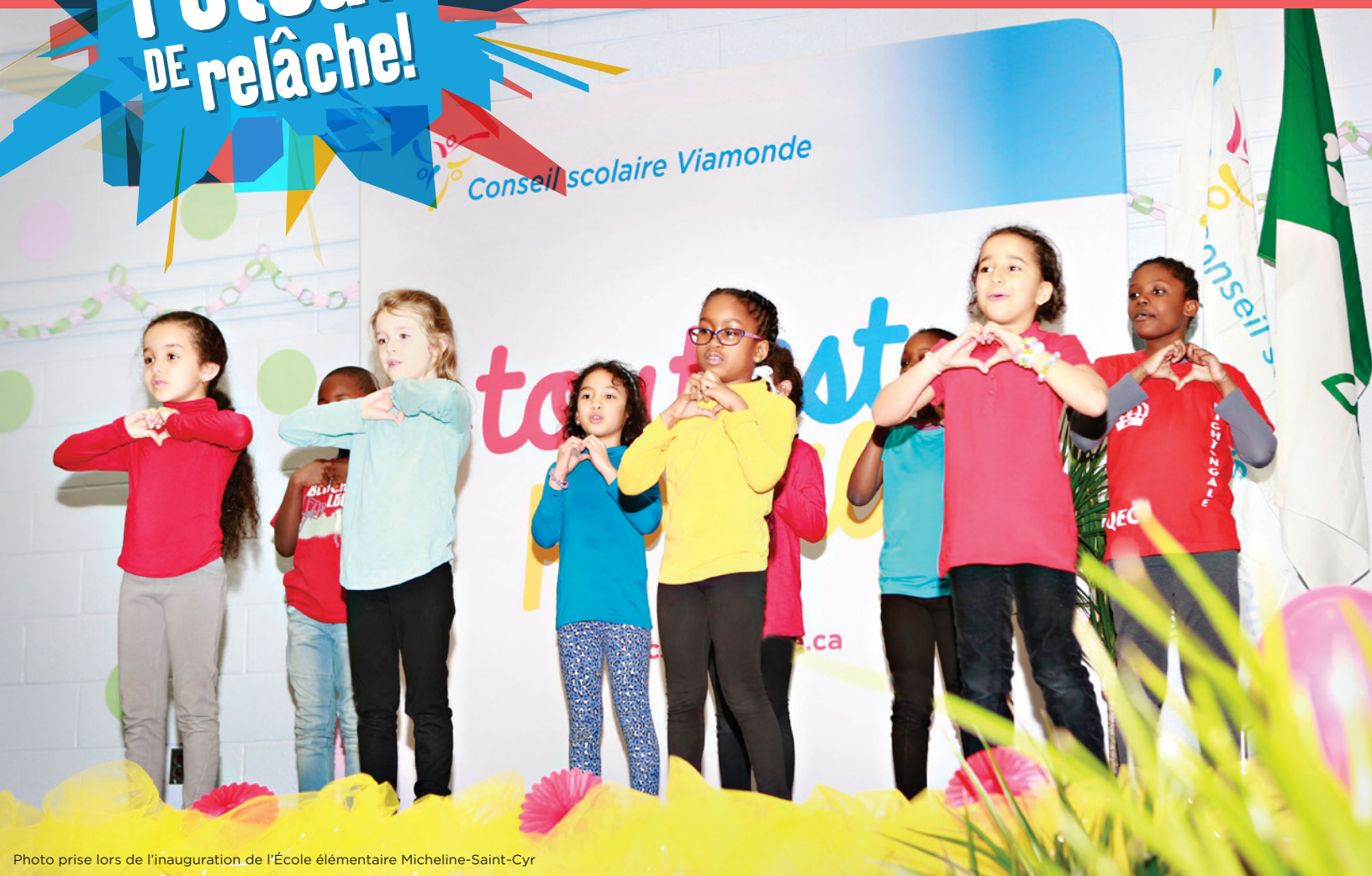
Photo prise lors de l'inauguration de l'École élémentaire Micheline-Saint-Cyr

Pour les élèves de Viamonde, tout est possible.